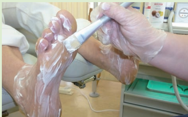
3. Streichen Sie die Unterseite des Fußes mit der Maske ein.