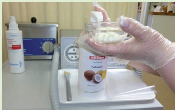
1. Geben Sie die Fußmaske in ein Schälchen.